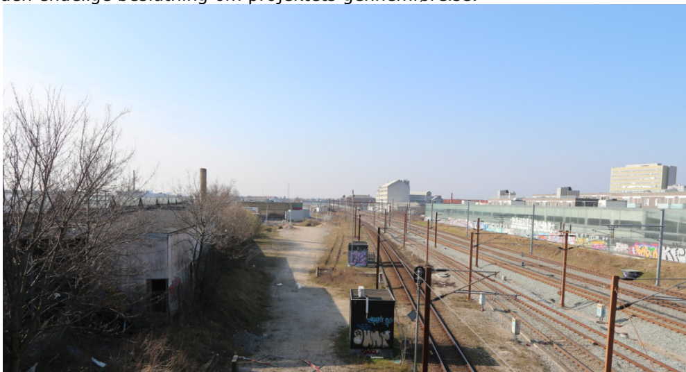
Området hvor den nye jernbanebro og udfletningsanlæg skal anlægges

Miljøredegørelsen skal give en samlet beskrivelse af projektet og dets miljøkonsekvenser, som kan danne baggrund for såvel en offentlig debat, som den endelige beslutning om projektets gennemførelse.