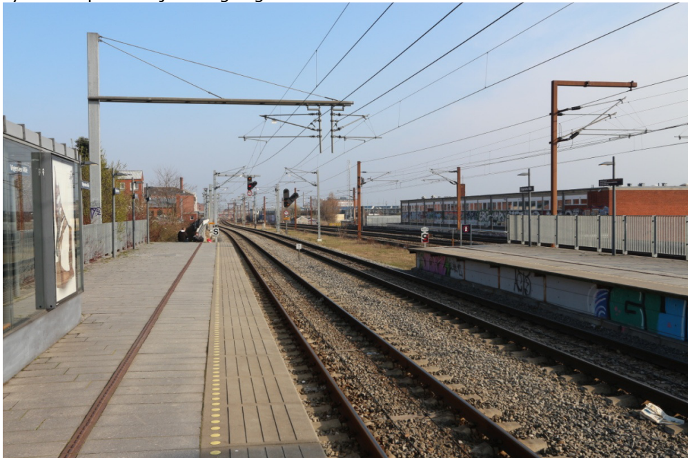
Sporene set fra Vigerslev Allé station mod området hvor den nye udfletning skal etableres.

Projektet vil have betydelig trafikal værdi ved at reducere konflikter mellem tog på Øresundsbanen og tog fra Den nye bane København-Ringsted. Udfletningen vil også være et element i etableringen af Ny Ellebjerg som et nyt knudepunkt i fjern- og regionaltrafikken.